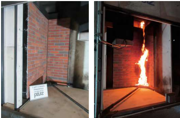
SBI-test volgens EN 13823: prefab renovatieschil, hier een complete mock-up van een renovatiegevel.

De brandbaarheid van de materialen aan de buitenzijde van de gevel wordt geïnclassificeerd volgens EN 13501-1. De eis is dan brandklasse B of D, en in de praktijk meestal de minst brandbare klasse B. In feite geeft de klasse aan hoe brandbaar het materiaal is (hoeveel energie er vrijkomt) en hoe snel een beginnende brand zich ontwikkelt (de versnelling van de brand). De maatgevende test bij brandklasse B of D is vaak de SBI-test volgens EN 13823.