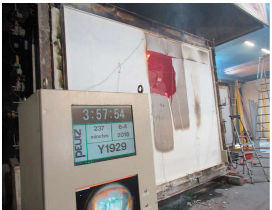
Brandtest volgens EN 1364-1: niet-dragende houtskeletbouw buitengevel.