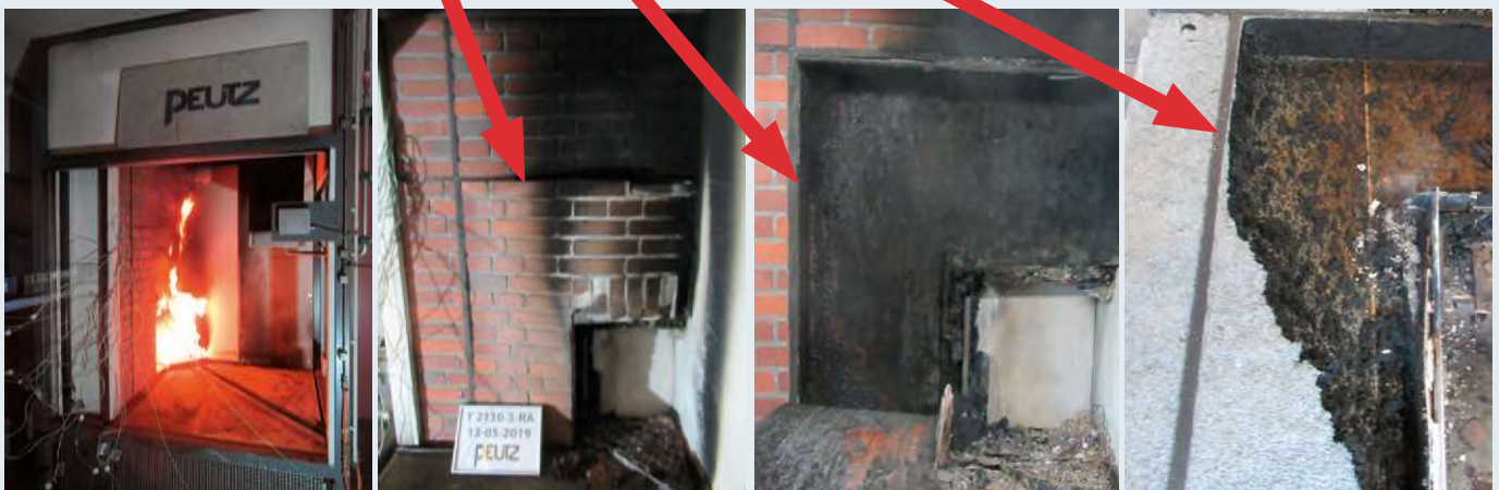
Verlengde SBI-test inclusief kunststof kozijn in analogie met EN 13823.

De brandvoortplanting stopt bij de barrières